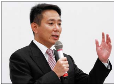
Japans tidligere udenrigsminister Seiji Maehara er en af de politikere, der beskyldes for omgang med mafiaen.

»De repræsenterer i deres selvforståelse alle de klassiske samurai-dyder. Det, samt at de generelt holder sig fra at genere almindelige mennesker, har gjort dem til en næsten accepteret del af det japanske samfund. Det fjerner også presset på politikerne for at gøre noget ved dem. Denne romantisme gør mig dårlig – de tjener deres penge ved pengeafpresning, stoffer, prostitution, menneskesmugning og økonomisk kriminalitet af en ufattelig størrelse. De er afskum.«